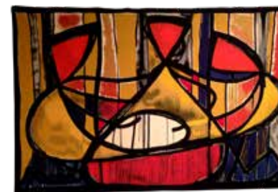
« Trinité concertation » Marc VAUGELADE - tapisserie

Peintures et tapisseries, avec le soutien de la Cité Internationale de la tapisserie d'Aubusson