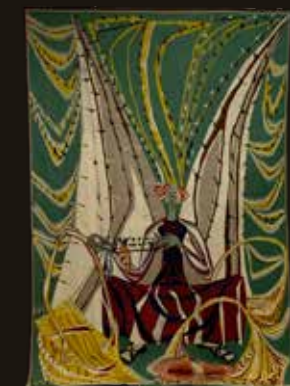
« Retour de pêche » Roger SOMVILLE, TAMAT tapisserie