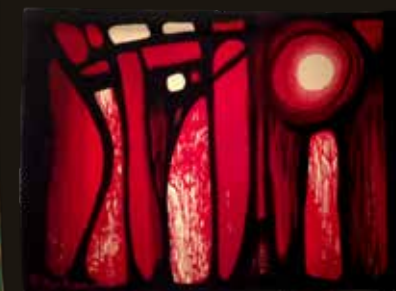
« Tropical » - Marc VAUGELADE tapisserie