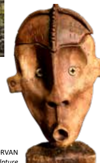
Franck MORVAN sculpture