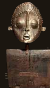
Franck MORVAN sculpture