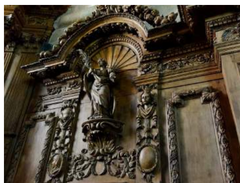
23150 MOUTIER D'AHUN

Visite incontournable de Moutier d'Ahun, à la rencontre de l'ancien monastère (adhérent à la Fédération des sites clunisiens) et des boiseries baroques qui font sa renommée. La visite inclut une balade dans le village et le pont roman.