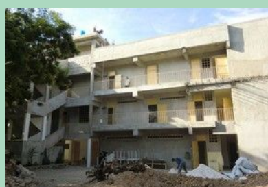
Façade sud vue du fond de la cour.

La cuve à eau au 3ème qui sert de château d'eau. Elle est reliée à la citerne située sous le bâtiment. Celle-ci contient 150 m 3 . L'eau est recueillie sur les toits en terrasses au 3ème. Avant le cyclone Tomas, il a fallu faire venir 2 camions d'eau (10 m 3 l'un) car la citerne était à sec. On est pourtant en fin de saison des pluies. Depuis le passage de Tomas, elle est à nouveau approvisionnée mais pour combien de temps ? Beaucoup d'enfants, d'étudiants et de maçons en même temps ! Et le béton pour les fondations du bâtiment 2 en nécessite aussi.