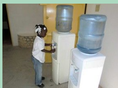
Sous le hall à disposition des enfants et des étudiants, eau de citerne filtrée et rafraîchie.

Cour de récréation. Les enfants jouent ici comme ailleurs mais ici les filles utilisent encore la grande corde à sauter.