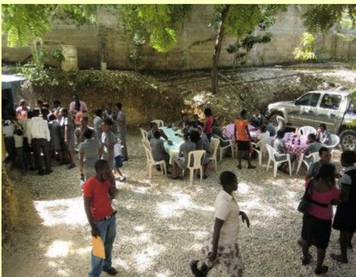
Les étudiants prenant leur repas-sandwich lors de la pause de 10h.

Cette année, l'école compte 7 classes : PS, MS, GS, CP1, CP2, CE1, CE2. Le CM1 sera ouvert l'année prochaine, le CM2 dans 2 ans. Les cours ont lieu de 8h à 13h, avec 2 pauses. L'accueil est assuré à partir de 7h30 par 2 étudiants « de service ». A la pause de 9h45, les enfants sortent un repas de leur « boîte à lunch » ou, pour les plus « fortunés », achètent casse-croûte et boisson à la « dame » qui prépare les sandwiches des étudiants. Les institutrices et instituteurs bénéficient aussi du sandwich gratuit.