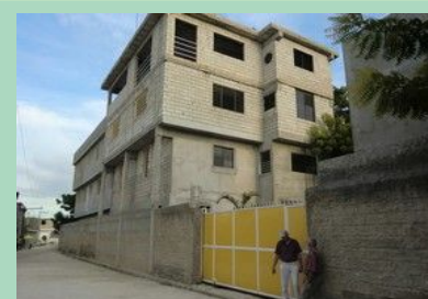
Pignon ouest vu de la rue et façade nord le long de la rue. Ce bâtiment est quasiment terminé ; toutes les salles sont utilisées et pleines "comme un oeuf".