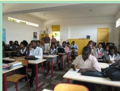
Etudiants de 3ème année dans la grande salle au rez de chaussée.