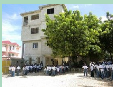
Bât 1 vu côté ouest avec enfants du matin rassemblés avant d'entrer en classe.

Au 1er plan, les travaux de terrassement du bâtiment 2 (normes parasismiques)