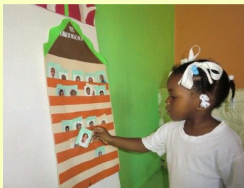
Une élève de petite section remplit sa case de "présence".