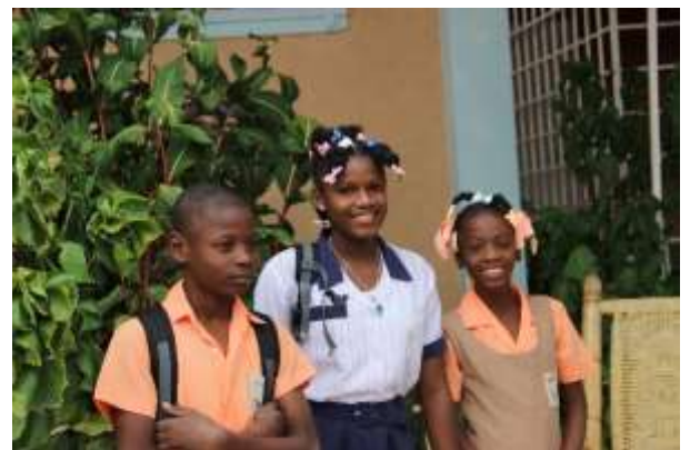
Des grands prêts à partir à l'école grâce aux parrainages

L'opération cartable organisée à chaque rentrée sera reconduite en 2017. Au moins trente élèves sont ainsi équipés grâce à vos dons.