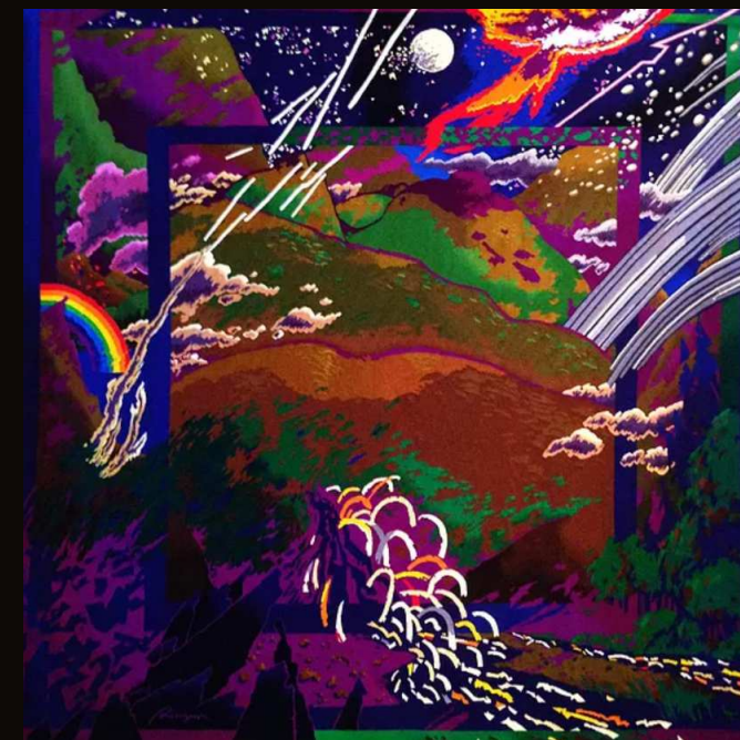
"La Terre" - œuvre de Daniel RIBERZANI tissée par l'"Atelier de la Lune"

13 mai > 17 octobre 2021 Moutier d'Ahun (Creuse) 18 rue de la Bergerie