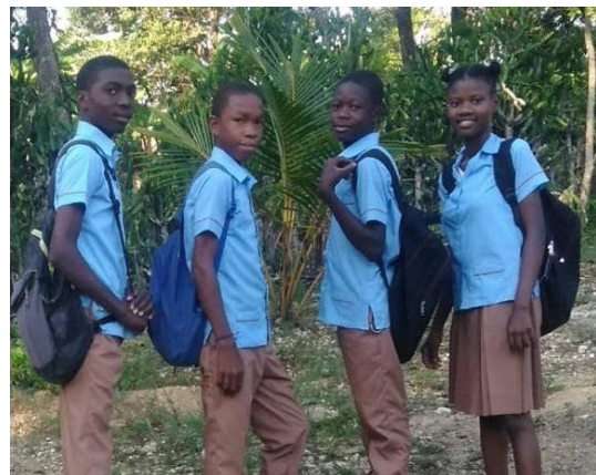
Toujours le sourire, courageux et volontaires!