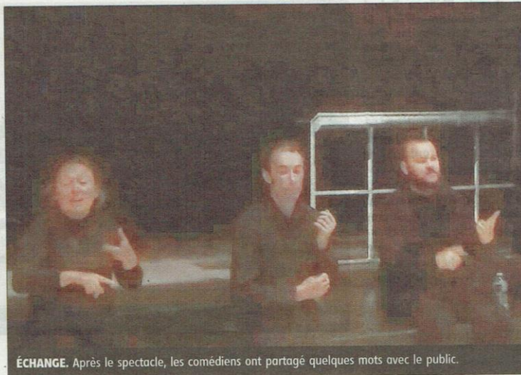
ÉCHANGE. Après le spectacle, les comédiens ont partagé quelques mots avec le public.

Maïté Martin a fabriqué, pour les animaux, deux marionnettes sur table déclinées en plusieurs for-